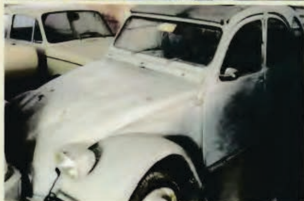
FOTO DEL VEICOLO DURANTE IL RESTAURO (graffare con punti metallici)

È INDISPENSABILE ALLEGARE PIÙ FOTO DA SOVRAPPORRE E GRAFFARE CON PUNTI METALLICI